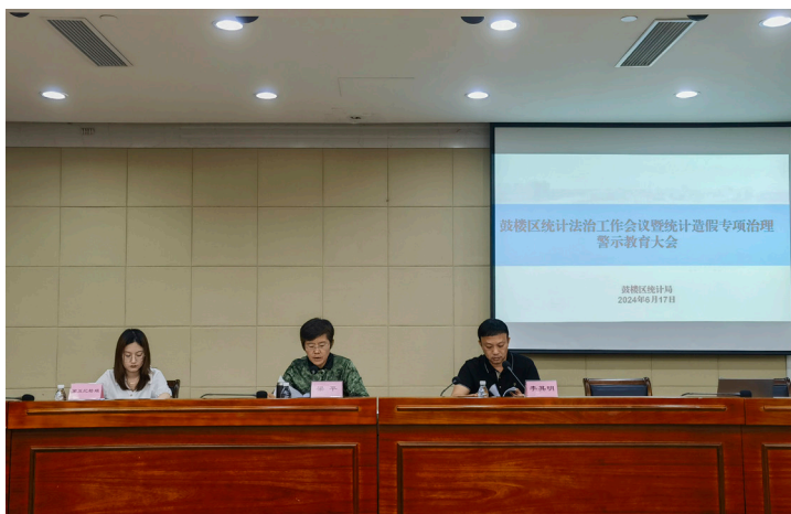
2024 年 6 月 鼓楼区统计局召开全区统计法治工作会议暨统计造假专项治理警示教育大会