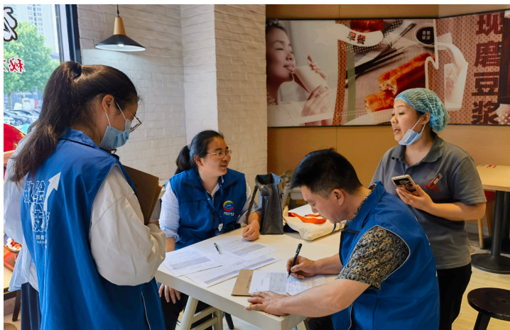
2024年5月 鼓楼区经普办于西城岚湾开展“五经普” 实地核查工作