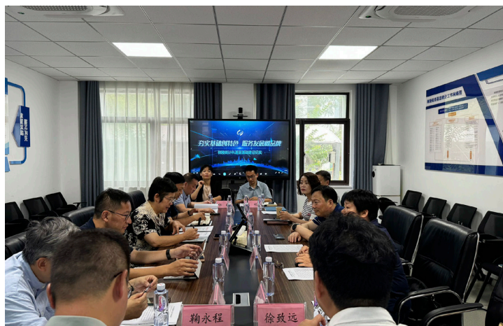
2024 年 7 月 鼓楼区统计局赴江宁区进行统计基层基础学习交流