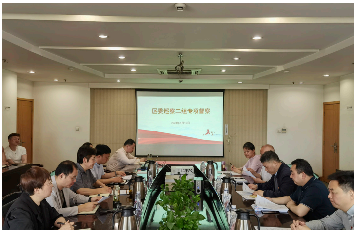
2024 年 5 月 鼓楼区委巡察二组在区统计局开展专项督察