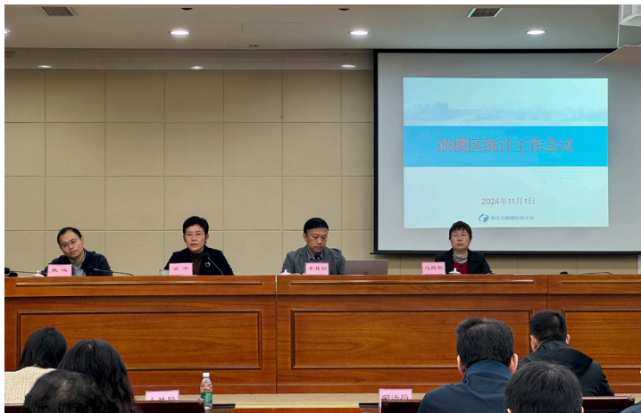
2024年11月 鼓楼区统计局召开全区统计工作会议学习贯彻新修改《统计法》