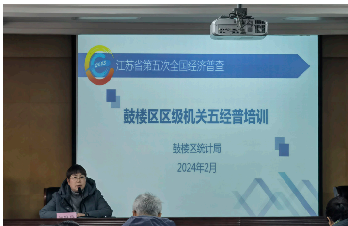
2024 年 3 月 鼓楼区统计局开展区级机关“五经普”培训会