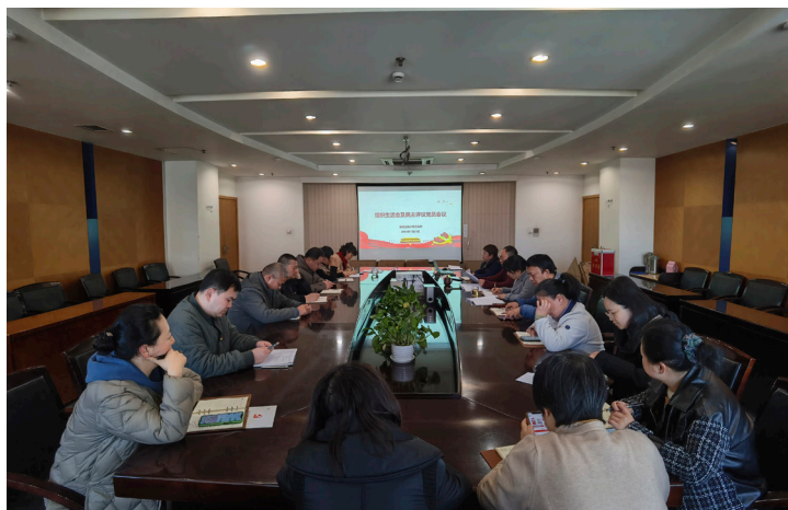
2024年1月 鼓楼区统计局召开组织生活会及民主党员评议会