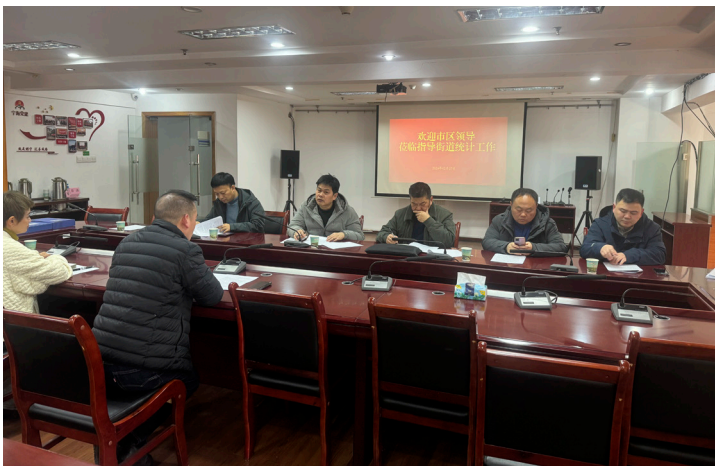
2024 年 2 月 南京市统计局赴鼓楼区宁海路街道开展统计基层基础检查工作