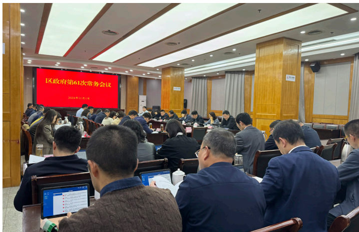
2024年11月 鼓楼区政府常务会学习新修改《统计法》