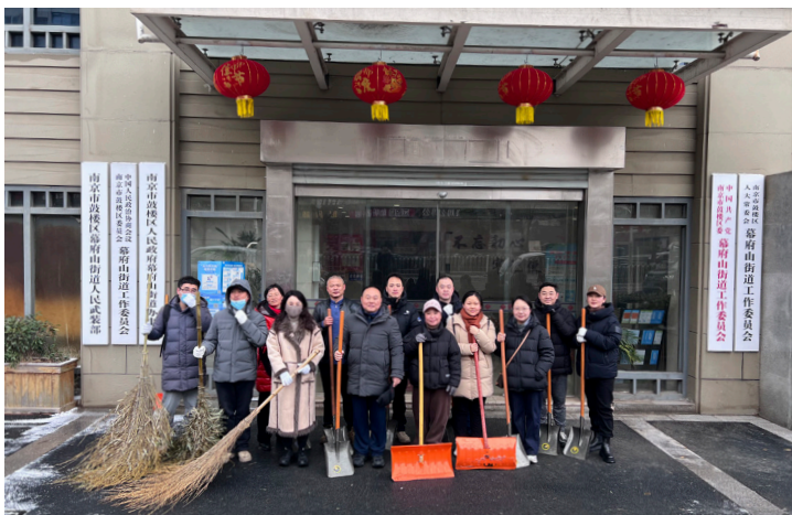
2024 年 2 月 鼓楼区统计局组织干部参加扫雪活动