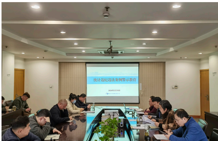
2024年3月 鼓楼区统计局召开统计违纪违法案例警示教育会