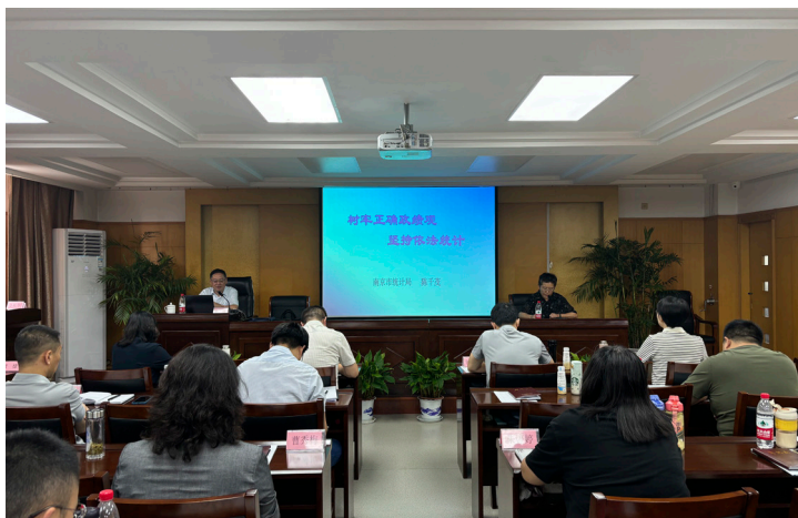
2024 年 9 月 鼓楼区邀请南京市统计局二级巡视员陈千茂在党校 开展新修改《统计法》学习教育