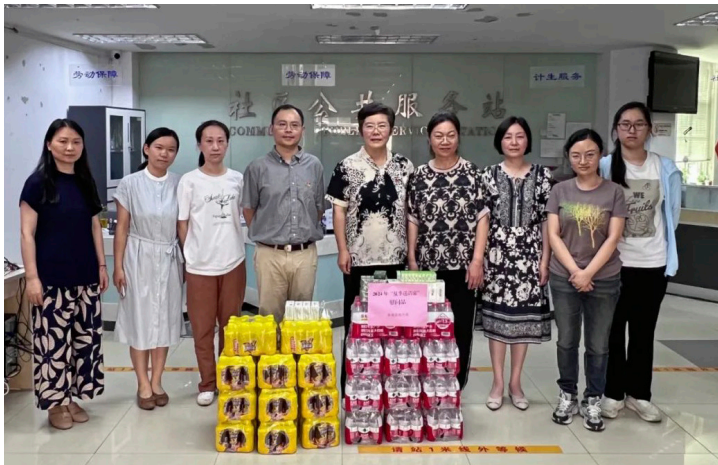
2024年8月 鼓楼区统计局走进五塘社区和白云社区送温暖