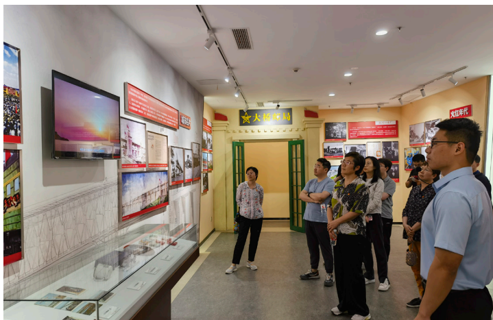
2024 年 6 月 鼓楼区统计局组织参观红色档案馆